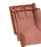
Tuile de ventilation TÉNORD (section avec grille 20 cm²) Réf. 311.20