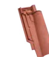
1/2 tuile TÉNORD Réf. 311.01