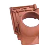
Tuile à douille TÉNORD diam. 126 utile Réf. 311.30