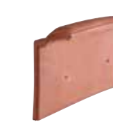
Rive individuelle gauche à recouvrement TÉNORD (4 au ml au pureau de 250 mm) Réf. 311.44 *